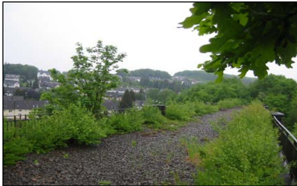
2008 [Quelle: BEG]